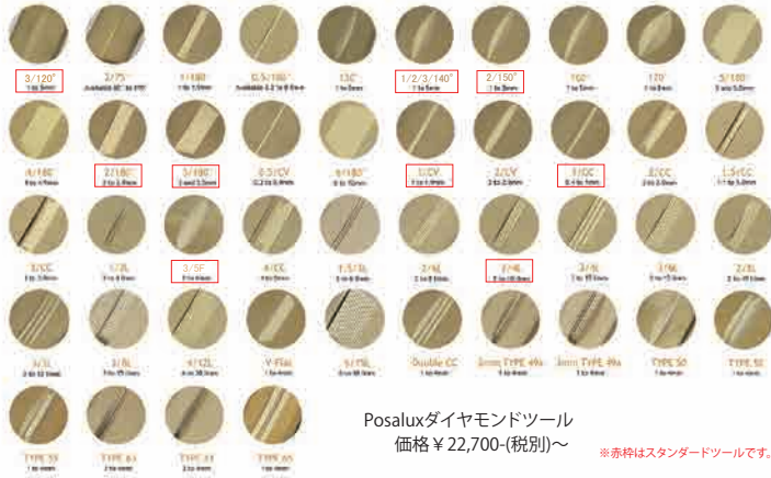
Posaluxダイヤモンドツール 価格 ¥22,700-(税別)~ ※赤枠はスタンダードツールです。