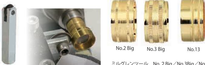
ミルグレンツール No. 2 Big/No.3Big/No.13 価格 ¥22,700-(税別)

機械に固定して使用します。指輪やバングルに簡単に正確にミルを施します。ミルグレンはそれぞれサイズと形が異なります。全33種類。多様なデザインに対応します。