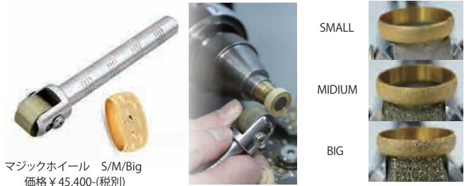
マジックホイール S/M/Big 価格 ¥45,400-(税別)

基本的に、ダイヤモンドマジックホイールを手で持ち、旋盤で稼働している結婚指輪やバングルに当てることでキラキラとした表面加工が可能です。カットと組み合わせることにより、独自のテクスチャーを入れる事が可能です。荒さは、3種類からお選びいただけます。