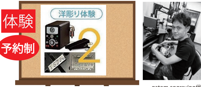
gatom engraving代表 青野氏