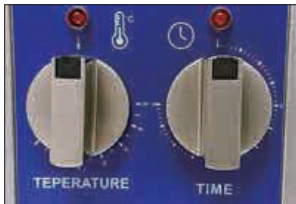
温度調整機能付き洗浄タイマー