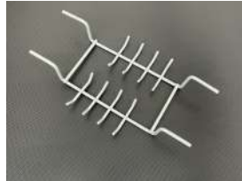
オプション 引っ掛け 16個掛け (170H適合) 200x115x40mm ¥2,900- (税別)