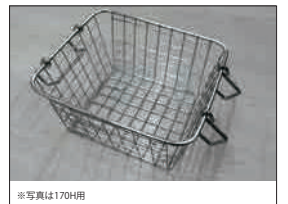
※写真は170H用 オプション ステンレスバスケット 170H用 ¥1,000- (税別) 320H用 ¥1,500- (税別) 640H用 ¥3,000- (税別)