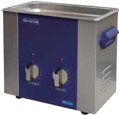
SUC-320H 引っ掛け 16個掛け (100H適合)