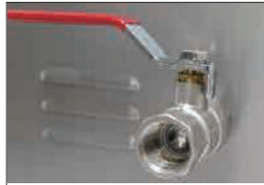
排水ドレンコック ※SUC-640Hのみ