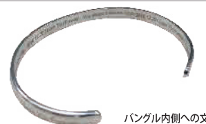
バングル内側への文字彫