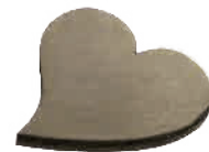
切抜き加工 ハート 真鍮/厚み1.0mm/サイズ 高さ12mm/52秒 50W