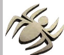
切抜き加工 蜘蛛 真鍮/厚み1.0mm/サイズ 高さ12mm/3分23秒 50W