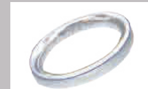
Ptマリッジリングへの文字入れ